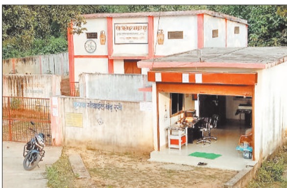
बंद पड़ा लेमरु गैस वितरण केंद्र।

ग्रामीण वितरक योजना अंतर्गत लेमरु में शुरू किए गए गैस एजेंसी वितरण केंद्र बीते एक साल से बंद पड़ा है। जबकि 335 सिलेंडर की राशि कंपनी में जमा करा दी गई है लेकिन कुछ तकनीकी खामियों की वजह से सिलेंडर की सप्लाई नहीं होने के कारण स्थानीय