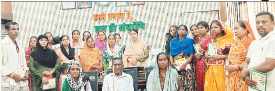
राशन कार्ड वितरित करती नपा अध्यक्ष व हितग्राही।