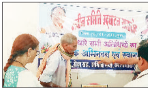
हरिभूमि न्यूज ►► मड़वारांनी