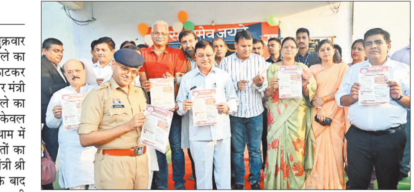
महिला थाना का उद्घाटन करते श्रम व उद्योग मंत्री व अन्य।