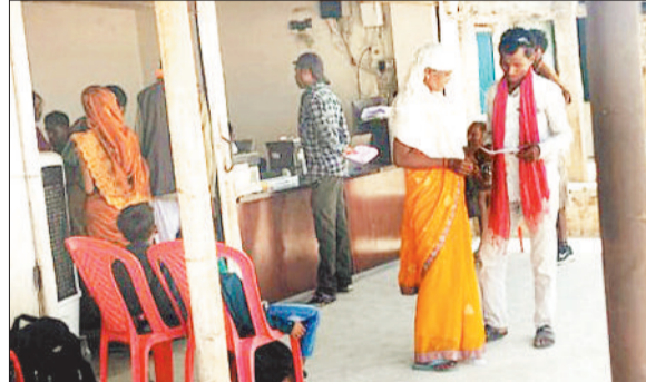
च्वाइस सेंटर में लगी हितग्राहियों की भीड़।

मुख्यमंत्री विष्णुदेव साय की सरकार ने महिला सशक्तिकरण के अंतर्गत महतारी वंदन को योजना चुनाव के बाद क्रियान्वित किया। जबकि चुनाव के दौरान इसे घोषित किया गया था। तब से लगातार पात्र हितग्राहियों को हर महीने एक हजार रुपए की सहायता दी जा रही है।