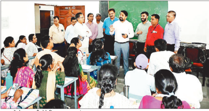
प्रगणकों से जानकारी लेते निगम आयुक्त एवं अन्य।